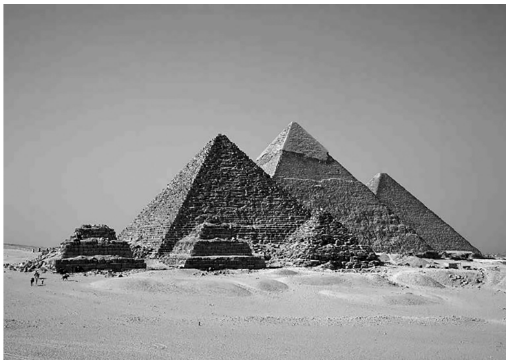
Fig. 1.1. Piramidele de la Giza

timpurie, de acum circa 5 000 de ani, perioadă în care a răsărit această civilizație. La acea vreme au fost realizate lucrări la o scală enormă. De atunci, piramidele, în special Marea Piramidă de pe Platoul Giza (fig. 1.1), au fost considerate drept unul dintre marile mistere ale umanității, atestând apariția încă din zorii civilizației umane a unor abilități foarte avansate (se crede că Piramida Greacă a fost finalizată în 2560 î.Hr.). Ne obsedează construcția acestei piramide, dar și a altora, pentru că nu suntem suficient de capabili să ne dăm seama ce i-a motivat pe cei care le-au construit.